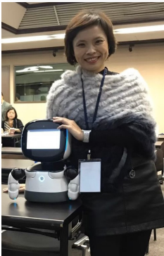
美麗主持人與可愛機器人